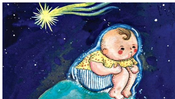
Imagem: Menino de aproximadamente dois ou três anos, vestido com uma camiseta amarela de bolinhas vermelhas e short branco de listas azuis sentado em um relevo, no fundo da tela azul escuro com estrelas e dentre elas uma cadente.

https://saude.abril.com.br/mente-saudavel/o-que-e-autismo