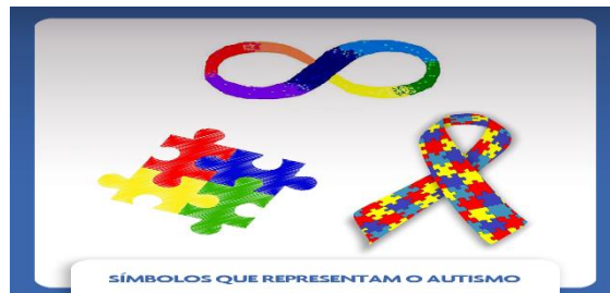
Imagem: Retângulo com fundo cinza, no centro três imagem que representam o autismo: quebra cabeça, a fita de conscientização e o logo tipo da neurodiversidade, nas cores primárias.

https://institutopensi.org.br/blog-saude-infantil/simbolos