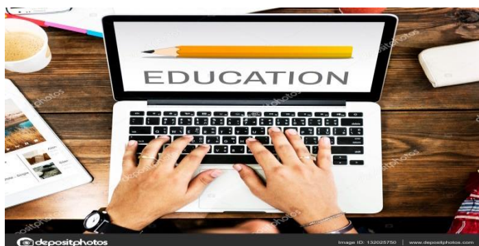
Imagem: Mãos digitando em um notebook, e na tela escrito em inglês: educação com um lápis amarelo na horizontal acima da palavra.