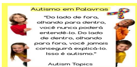
Imagem: Retângulo com bordas amarelas com duas crianças de cada lado segurando um cartaz escrito: Autismo em Palavras. "Do lado de fora, olhando para dentro você nunca poderá entendê-lo. Do lado de dentro, olhando para fora, você jamais conseguirá explica-lo. Isso é autismo. Autism Topics.

https://medium.com/@eltonwade/como-%C3%A9-viver-com-autismo