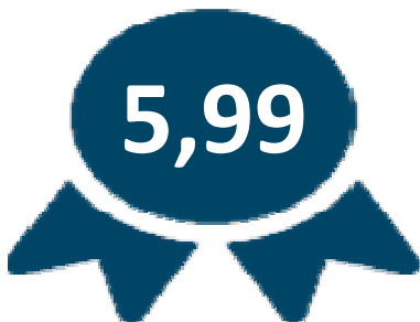
IDEPE - Série Histórica