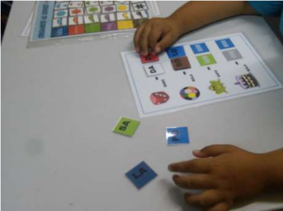
Fotografia: Braços de uma criança realizando atividade formando palavras, por sílabas, com as respectivas imagens ao lado. Dado, bola, sapo e bolo

“...aprendizagem é uma modificação do comportamento do indivíduo em função da experiência...”