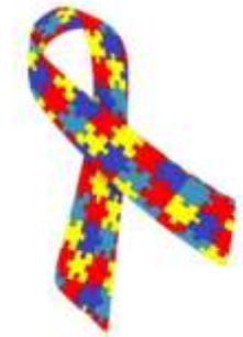
Imagem: laço com peças de quebra cabeça colorido, símbolo do autismo https://br.images.search.yahoo.com/search/images;_ylt=AwrJ4hAR