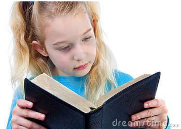
Fotografia: Menina lendo um livro com a capa preta.

https://www.google.com.br/search?q=crian%C3%A7a+lendo&tbn=isch&ved