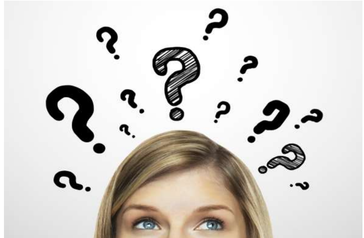
Fotografia: Rosto de mulher, dos olhos para cima, com várias interrogações ao redor http://blogemagrecimento.com/dieta-funciona-o-que-fazer-para-funcionar/