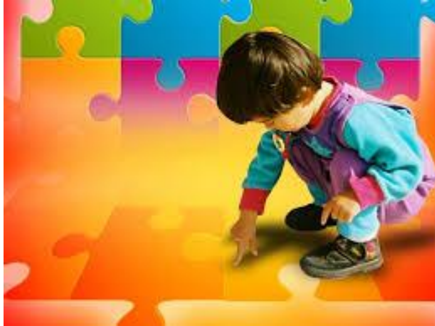
Imagem: menino agachado olhando para o chão, com o dedo indicador direito apontando o chão. Plano de fundo com imagem de quebra-cabeça colorido.

https://www.google.com/url?sa=i&url=http%3A%2F%2Fproge.ne.ib.usp.br%2Ftranstorno-do-espectro-autista%2F&psig=