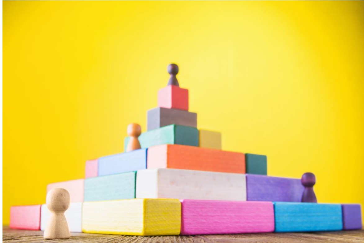
Imagem: Pirâmide de blocos retangulares coloridos, com seis andares. Há quatro pinos em cores diferente, e em pontos diferentes da pirâmide

https://www.sbcoaching.com.br/blog/wp-content/uploads/2018/06/piramide-de-maslow-identificando-suas-motivacoes.jpg