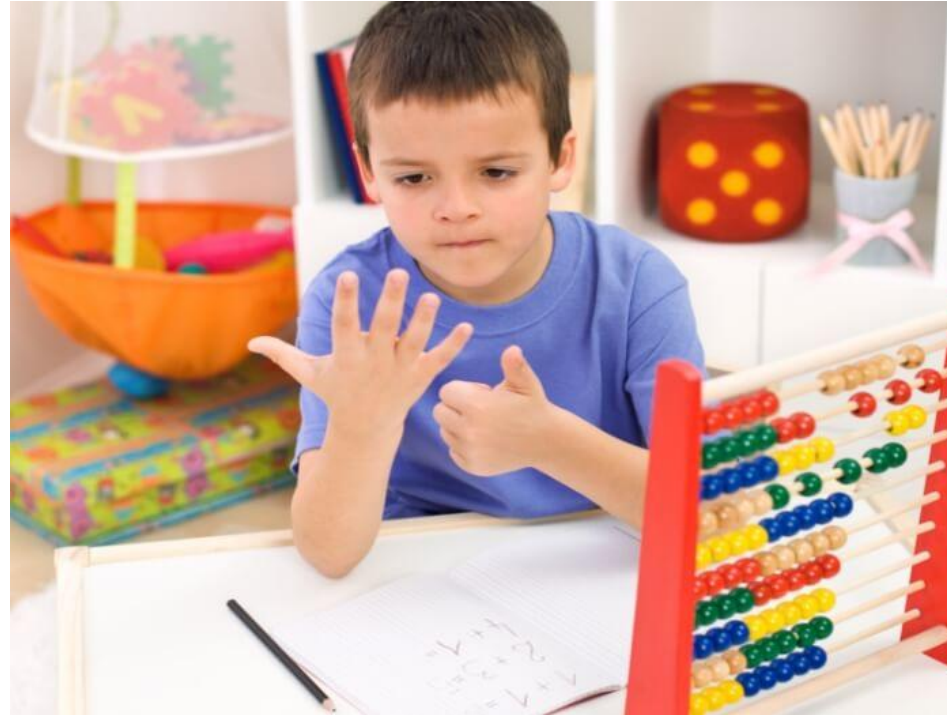
Imagem: menino vestindo camisa azul, com braços apoiado em uma mesa, olhando para as suas mãos que mostram a quantidade seis nos dedos. Em volta, jogos pedagógicos de matemática.

https://lndufmg.files.wordpress.com/2020/05/foto-crianc3a7a.jpg?w=700